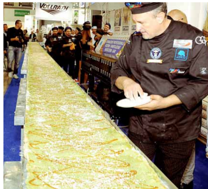
FRANCESCA, PIZZA DOLCE PIÙ LUNGA DEL MONDO