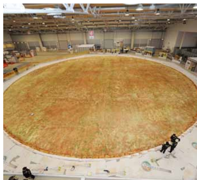
OTTAVIA PIZZA TONDA PIÙ GRANDE DEL MONDO

Un Corso che permetterà a giovani e meno giovani di entrare nel mondo del lavoro in un settore che non conosce crisi,