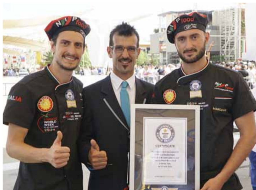
GUINNES PIZZA PIÙ LUNGA DEL MONDO

Il Corso Base per la Professione di Pizzaiolo e' dedicato a tutti coloro che vogliono muovere i primi passi nel settore pizza con adeguate basi teoriche e pratiche per preparare una pizza ad arte.