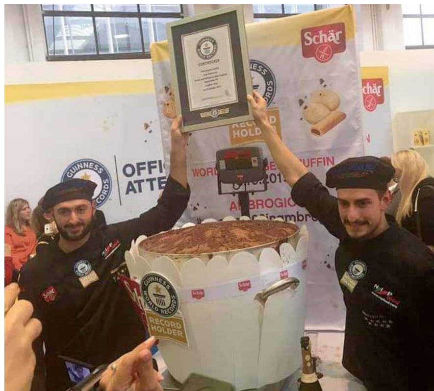
AMBROGIO MUFFIN PIÙ GRANDE DEL MONDO