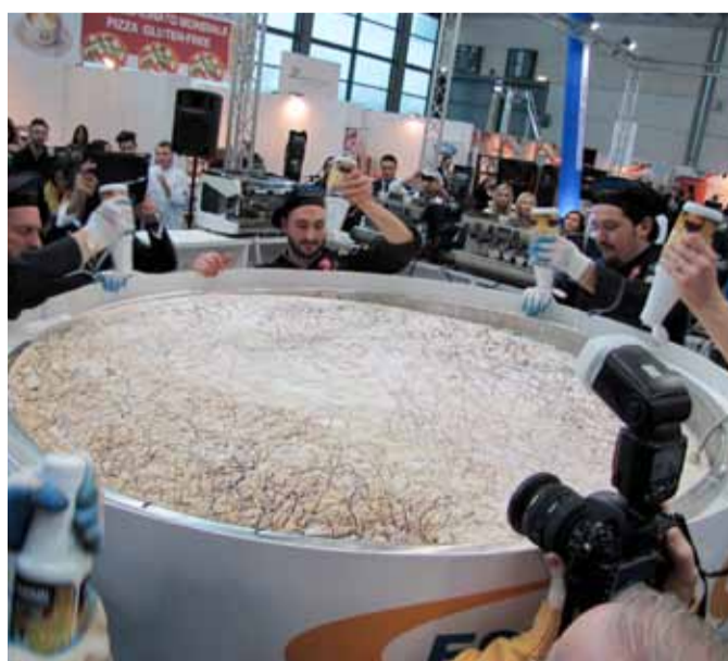
DAVIANO CAPPUCCINO PIÙ GRANDE DEL MONDO

il primo corso è iniziato il 29 febbraio. Alla fine del Corso verrà rilasciato un attestato di Formazione NIP e la Divisa Ufficiale della Nazionale Italiana Pizzaioli.