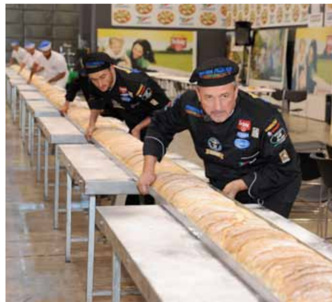
FRANCESCO, PANE GLUTEN FREE PIÙ LUNGO DEL MONDO